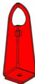
Festeøyne for singel punkt